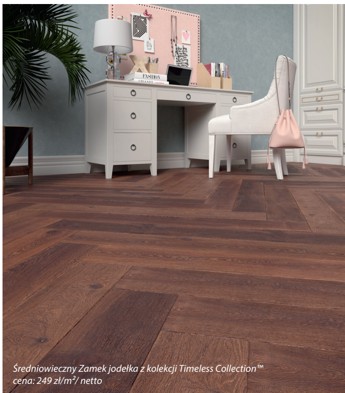
Średniowieczny Zamek jodełka z kolekcji Timeless Collection™ cena: 249 zł/m 2 /netto