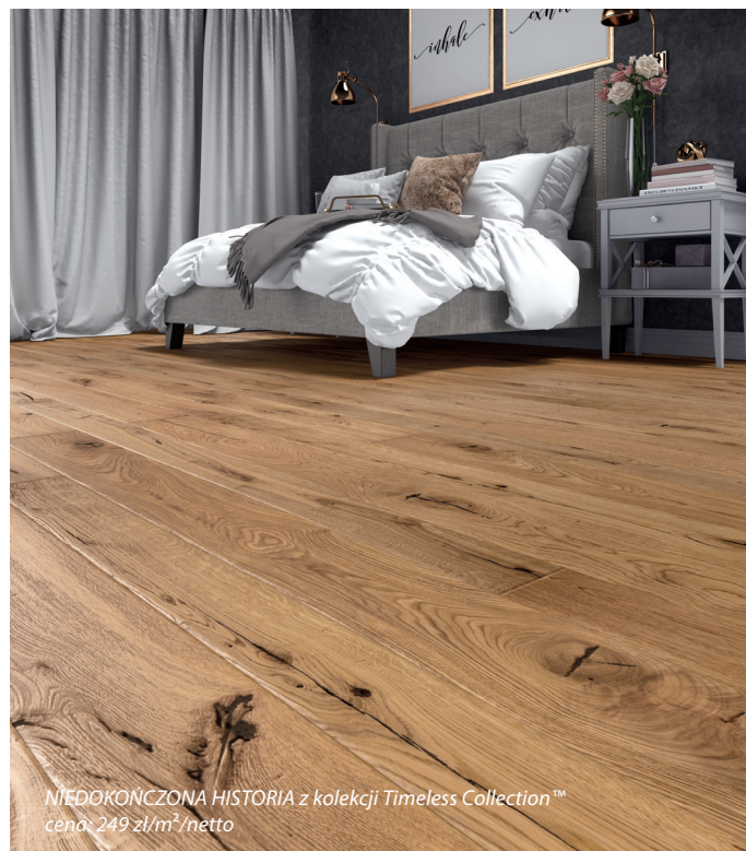
NIEDOKOŃCZONA HISTORIA z kolekcji Timeless Collection™ cena: 249 zł/m 2 /netto

Baltic Wood to polski producent trójwarstwowych podłóg drewnianych, który od 20 lat projektuje i wdraża kolekcje podłóg w kategorii PREMIUM, zgodnie z najnowszymi trendami w modzie i designie oraz wymaganiami rynku. Unikalna strategia marki i filozofia oparta na wartościach takich jak kreacja, estetyka, jakość, perfekcja, nowoczesność, ekoodpowiedzialność – okazała się receptą na sukces. Baltic Wood skupia się na zapewnieniu klientom szerokiego wyboru podłóg. W ofercie marki znajdują się 4 kolekcje podłóg, wykonanych z najlepszych gatunków drewna europejskiego i wybranych gatunków egzotycznych, tj. podłogi ręcznie postarzone (Timeless Collection™), ultrawytrzymałe (NoLimits Collection™), z identycznym wykończeniem na desce 1-rzędowej i klepce (Jeans Collection™) oraz w różnych rozmiarach i wykończeniach (Melody Collection™). Baltic Wood jako jedyny producent podłóg drewnianych w Polsce i czwarty na świecie został uhonorowany Red Dot Design Award w kategorii Product Design. Firma zajęła również I miejsce w plebiscycie konsumenckim „Dobra Marka – Jakość, Zaufanie, Renoma” i zdobyła specjalne wyróżnienie – godło „Super Marka” w kategorii: podłogi drewniane.